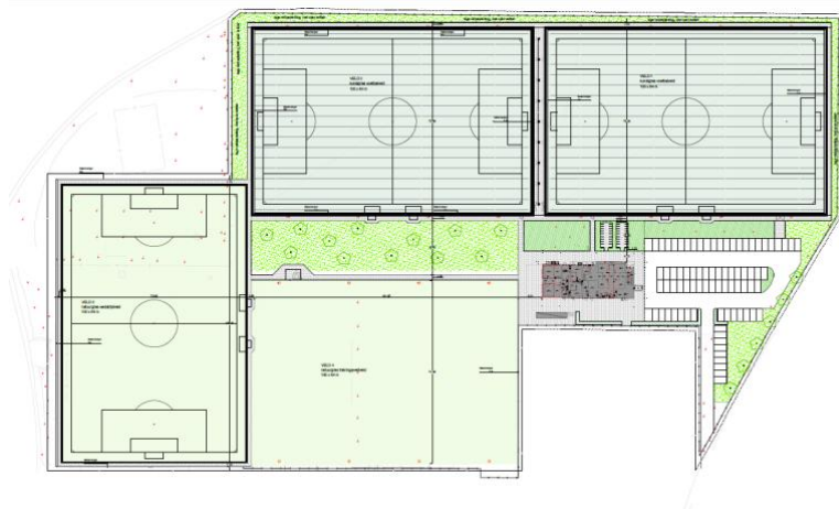
Tekening: Voorlopig ontwerp Sportpark Heugem